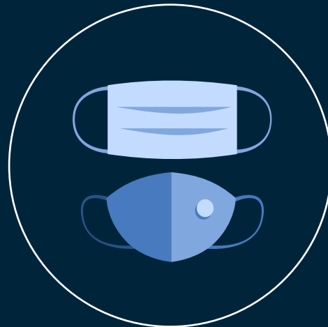
Υποχρεωτική χρήση μάσκας