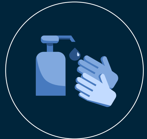
Αντισηπτικά σε όλους τους διαδρόμους