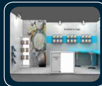
3D - Τυροκομικά

Οι επιλογές σε εξοπλισμό ενδέχεται να διαφέρουν ανάλογα με τον τύπο Premium περιπτέρου